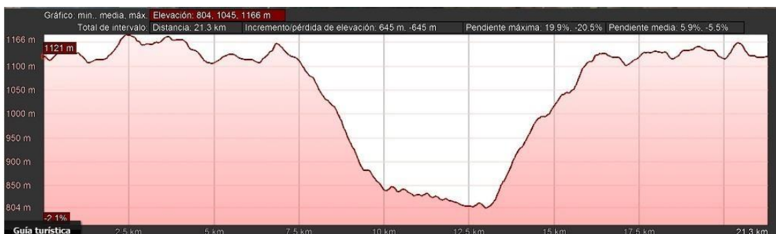
Perfil longitudinal media maratón

hasta las inmediaciones de Valdelagua del Cerro a unos 1160 m. para completar el recorrido alrededor de la localidad de Valdelagua del Cerro.