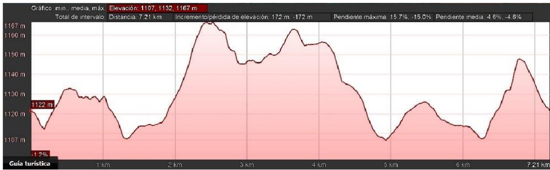
Perfil longitudinal carrera 7k

En cuanto al perfil de la prueba no se caracteriza por ser demasiado exigente. Se parte desde los 1122 metros dentro del casco urbano para luego ascender a los 1167 metros en el punto más alto. En cualquier caso, las pendientes en su mayoría son tendidas y no comportan riesgo alguno.