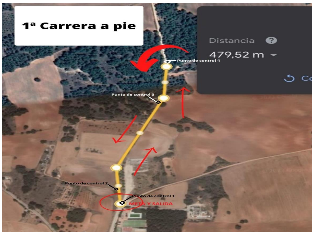
Primera carrera cadete/ juvenil

RECORRIDO: El recorrido de la prueba deportiva posee su inicio y final en el complejo deportivo de Jabaga dentro del núcleo urbano de la población de Jabaga, trazando el resto de recorrido por caminos cercanos al complejo. En ningún caso, afecta a cruces o tránsitos por carreteras convencionales. Puede verse la imagen representativa de los recorridos contemplados.