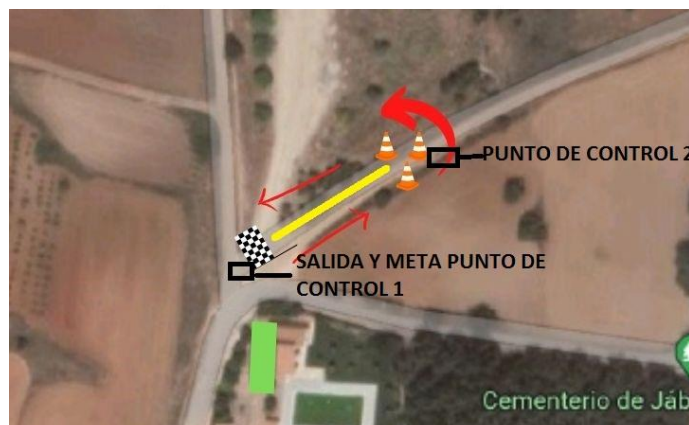
Primera y segunda carrera iniciación