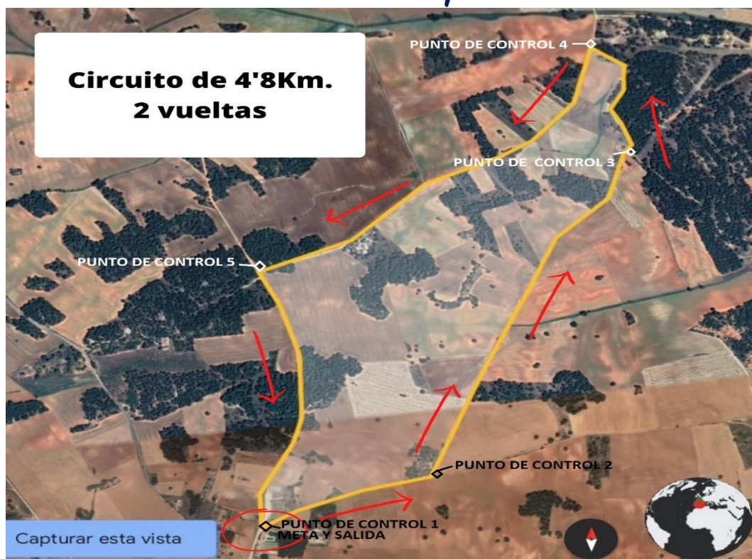
Sector ciclista cadete/juvenil