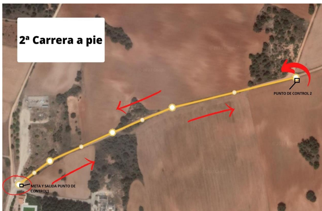
Segunda carrera a pie cadete/juvenil