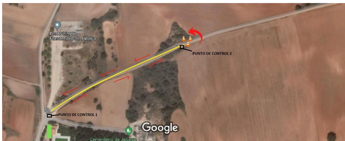
Primera y segunda carrera infantil/alevin