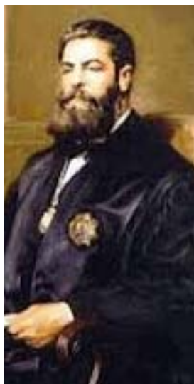
Joaquín Costa fue el introductor y Mariano Catalán el materializador del primer velocípedo español en 1867

Pero la historia de este proceso no arranca con la materialización de la obra de Catalán, en la herrería que tenía su familia en Huesca junto al Coso, al lado del Teatro Principal. El asunto viene de lejos. Todo se inicia con la presencia del joven Joaquín Costa, el insigne político aragonés, en la Exposición Universal de París de 1867. La capital francesa se convierte ese año en el epicentro de todos los avances hasta entonces conocidos. La primera etapa de la revolución industrial (1750-1840) había proporcionado múltiples avances e inventos de todo tipo. La industria había dado un paso de gigante en la producción de todo tipo de maquinaria. Pierre Michaux, un constructor de carrozas, desde 1861 venía aplicando palancas con pedales a la rueda delantera de sus prototipos, muestra su sorprendente máquina a los miles de ávidos buscadores de tecnología que pasan por la Exposición Universal de París.