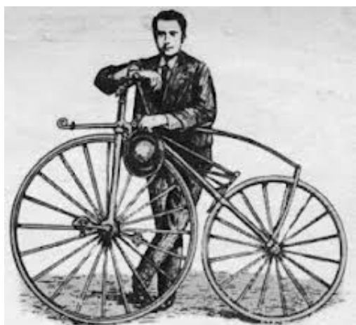
Pierre Michaux con su velocípedo

Joaquín Costa está en la capital francesa becado por la Diputación de Huesca para captar ideas para el desarrollo de la agricultura en el Alto Aragón. En su localización de nuevas tecnologías queda sorprendido cuando encuentra el vehículo de Michaux. En un papel de fumar dibuja con todo detalle su elemental esqueleto, y especialmente su principal apartado: la rueda delantera con las palancas o pedales que le permiten la autoimpulsión. Eso ocurre a finales de octubre de 1867. En torno al famoso dibujo de Costa se ha vertido alguna que otra leyenda urbana. Ciertamente no se ha localizado y es posible que ya no exista, pero testimonios indirectos de probada validez lo dan como cierto.