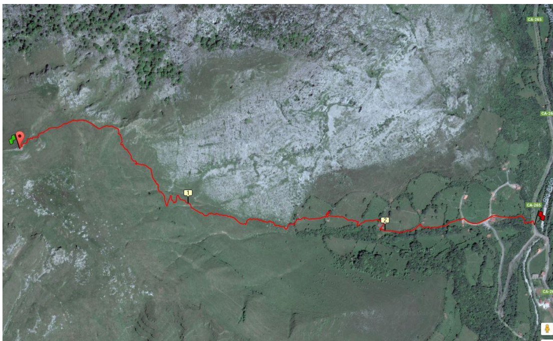
Plano topográfico del recorrido de la carrera