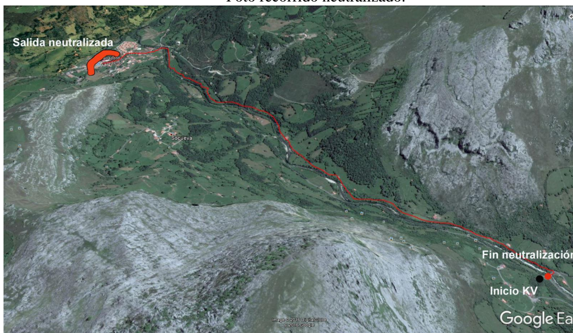
Foto del recorrido de la carrera.