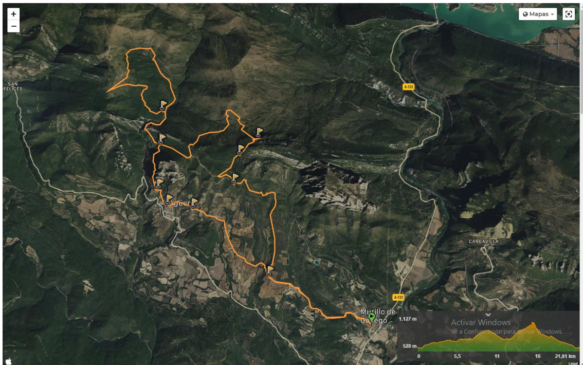
Foto 1. Recorrido Murillo-Agüero-Sant Esteban–Punta Común-Murillo

Wikiloc | Ruta IX Carrera Reino de los Mallos 21,8 km Murillo Agüero Sant Esteban Punta Comun Murillo de Gállego