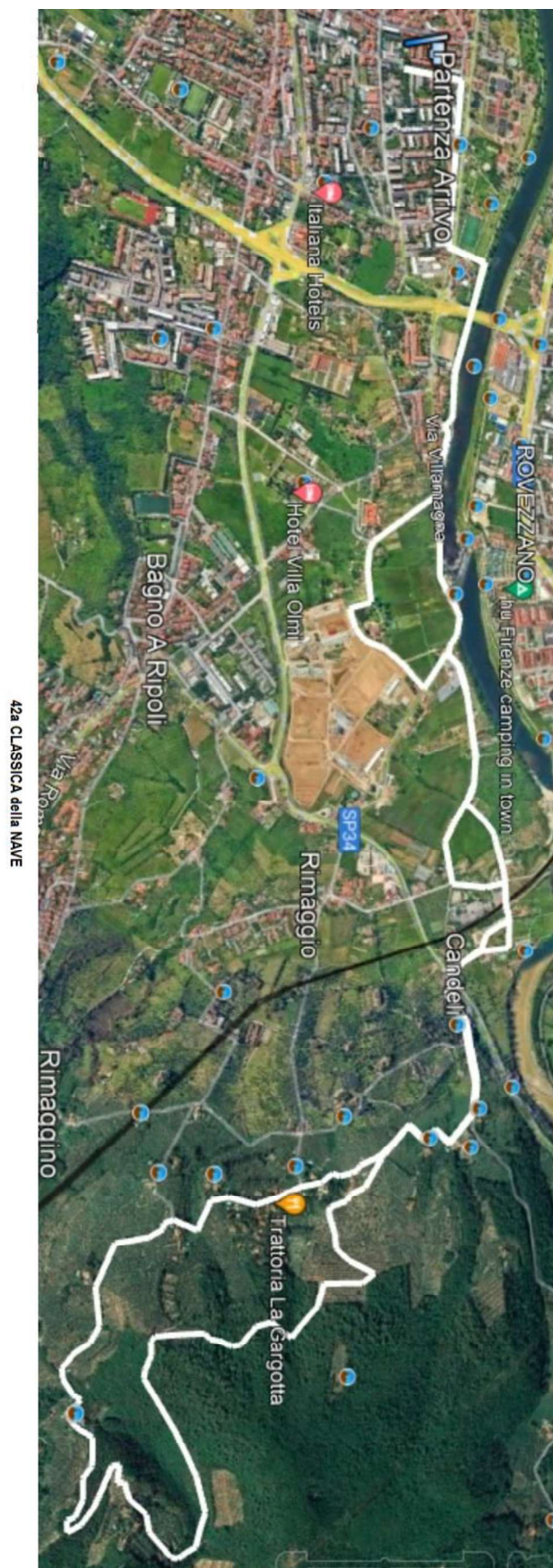
42a CLASSICA della NAVE