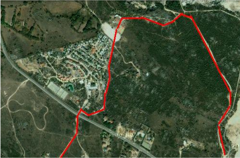
(SUBIDA AL PICACHUELO)