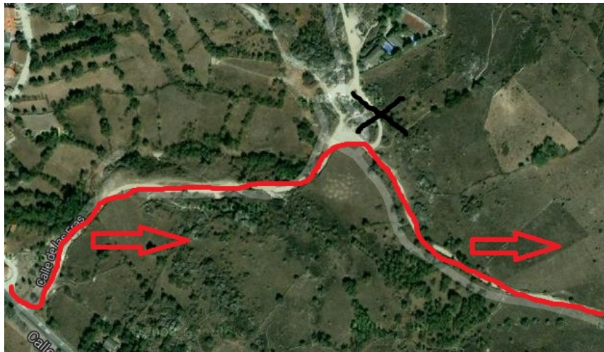
(SALIDA DEL PUEBLO Y ENTRADA A LOS CAMINOS)