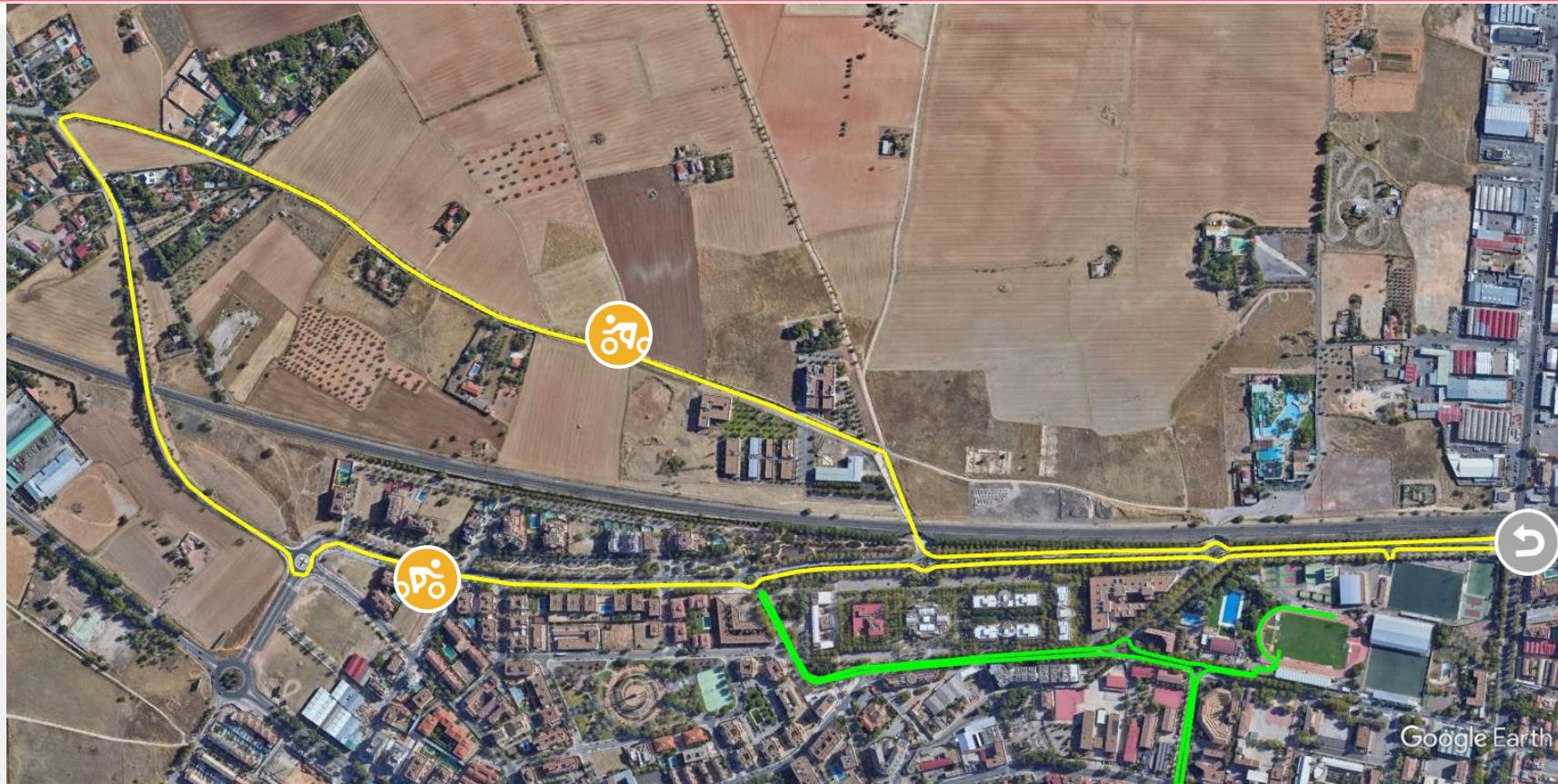
Gráfico: min., media, máx. Elevación: 625, 628, 633 m Total de intervalo: Distancia: 5,34 km Incremento/pérdida de elevación: 27,7 m, -27,6 m Pendiente máxima: 5,2%, -3,0% Pendiente media: 1,1%, -0,9%